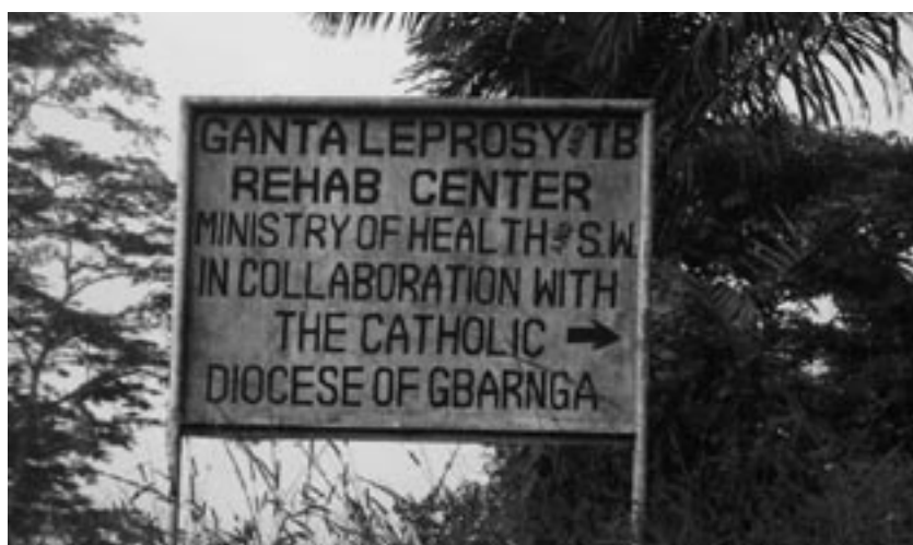
Entréskylten till Ganta. Katoliker hänvisas till höger.