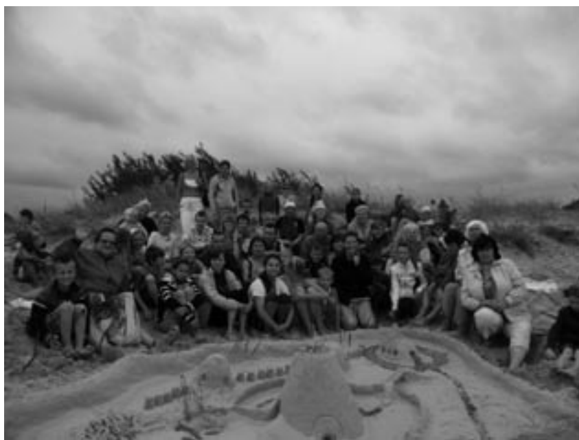
Strandsandsbygge och bad för lägerbarnen.

Vid ett annat tillfälle kom ett gäng barn och ungdomar och dansade folkdans för oss – uppskattat.